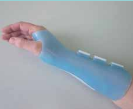
individuelle Silikon-Unterarm-Handorthese in Funktionsstellung