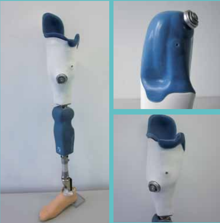
HTV-Innenschaft für Oberschenkel-Prothese in M.A.S Schafftechnik