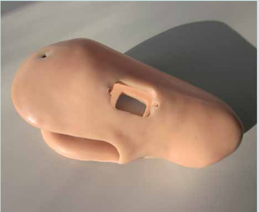
HTV Silikon-Innenschaft nach Maß für Unterarm-Myoprothese