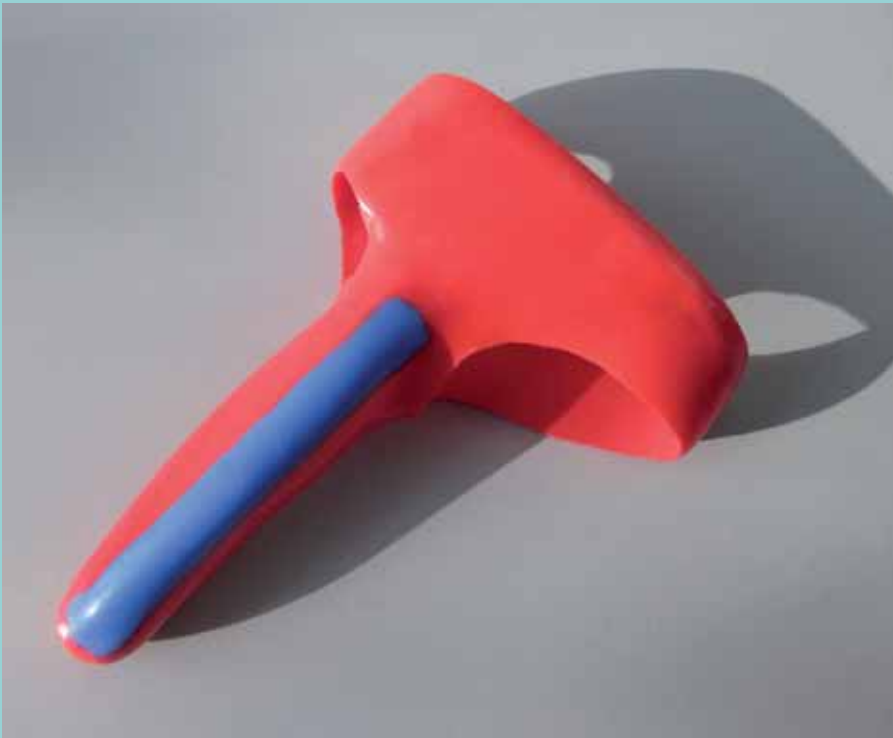
Silikon-Fingerorthese nach Maß