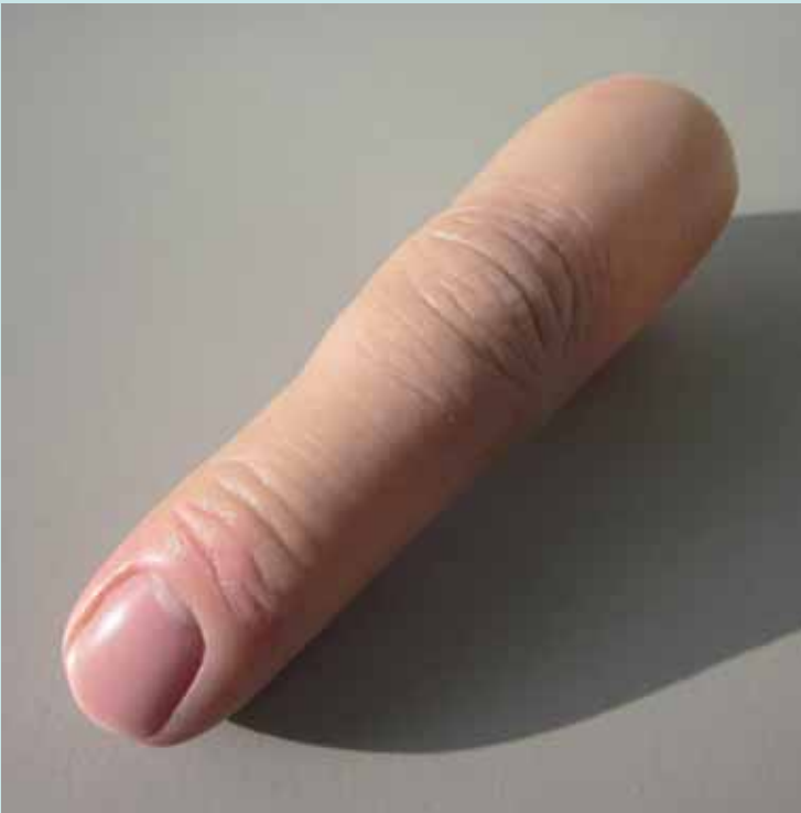
Silikonfingerprothese » Classic « nach Maß