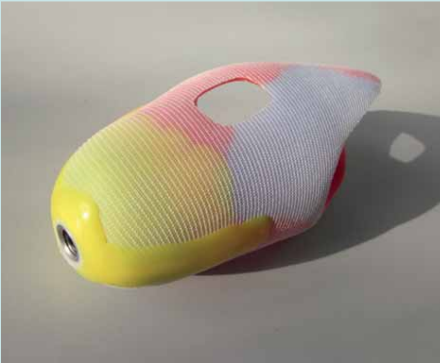
Silikon-Liner nach Maß für Unterarmprothese mit eingearbeiteten Fenstern für Myo-Elektroden