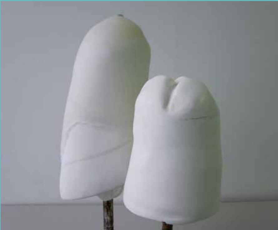
Silikon-Liner mit Narbenausgleich nach Maß