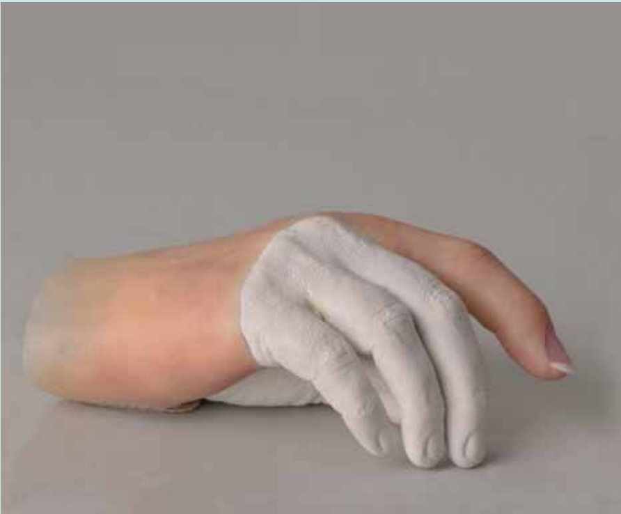
Teilhandprothese aus Silikon » Premium « nach Maß (auch in » Basic « und » Classic «)