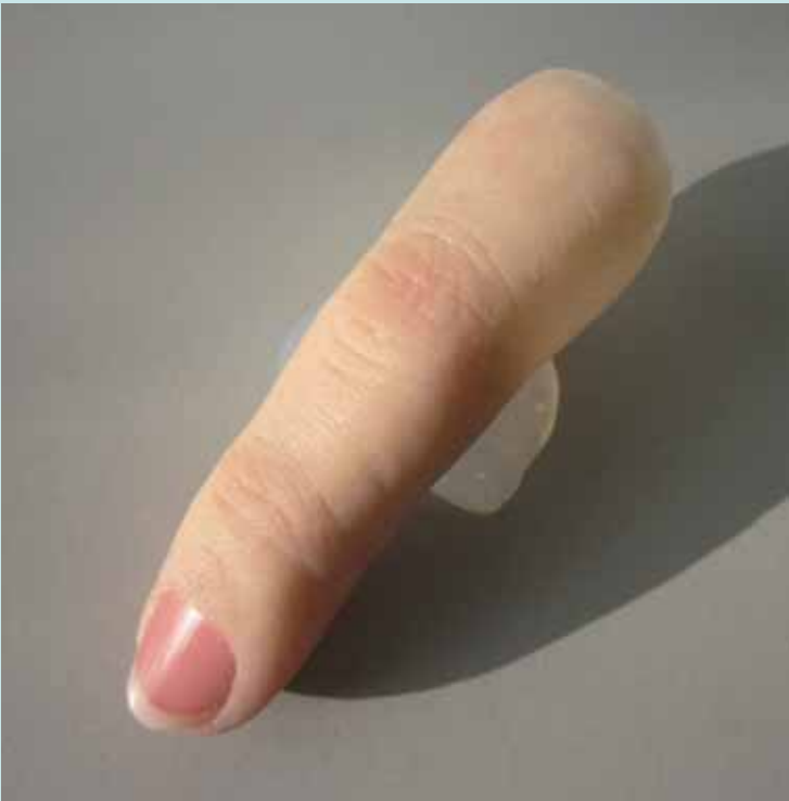
Silikonfingerprothese » Premium « mit Acrylnagel nach Maß