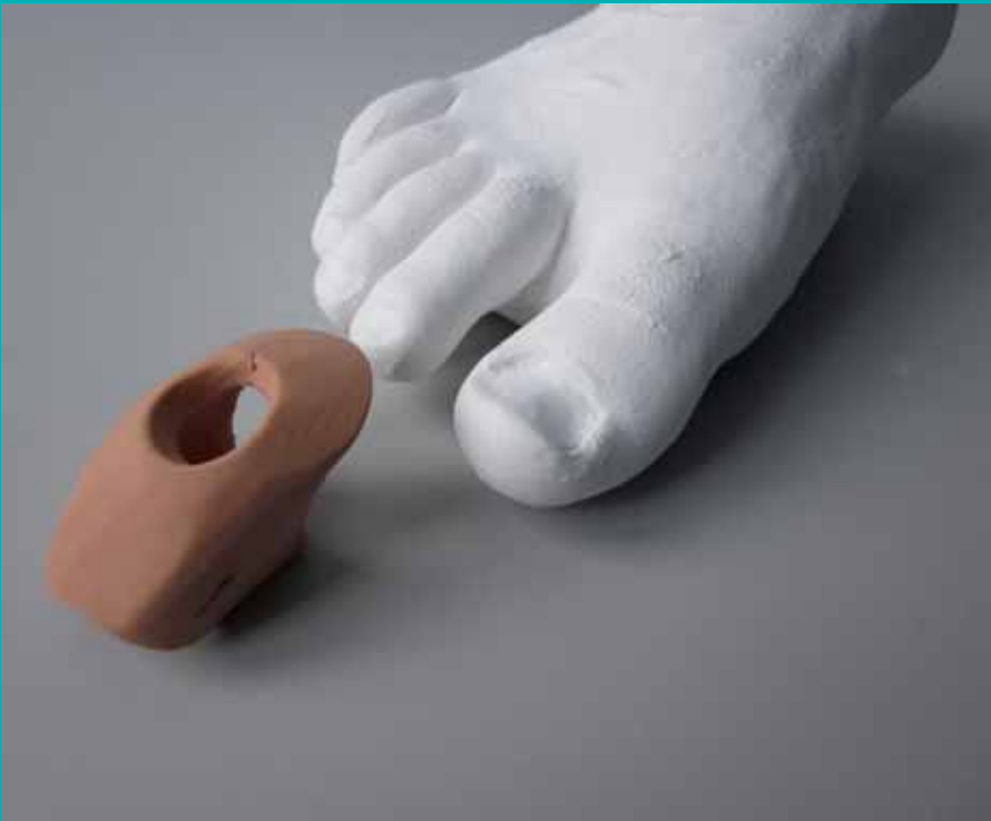
Zehenorthese aus Silikon nach Maß