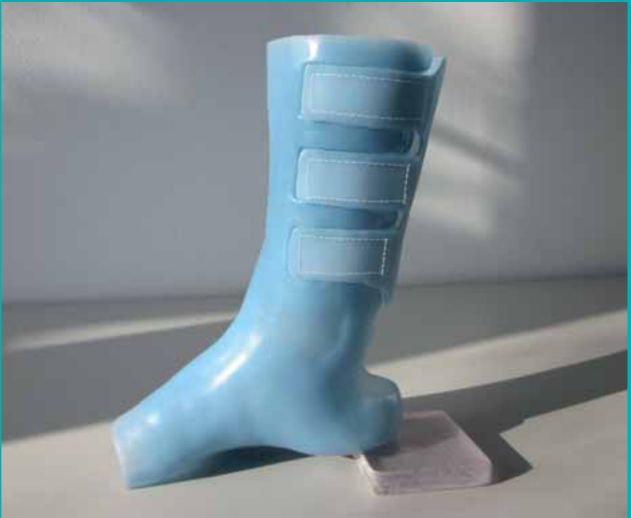
Peroneusorthese aus Silikon nach Maß