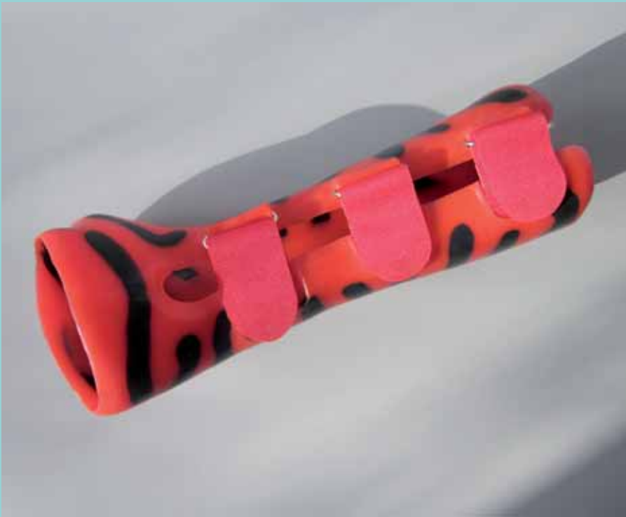
Silikon-Unterarm-Handorthese nach Maß