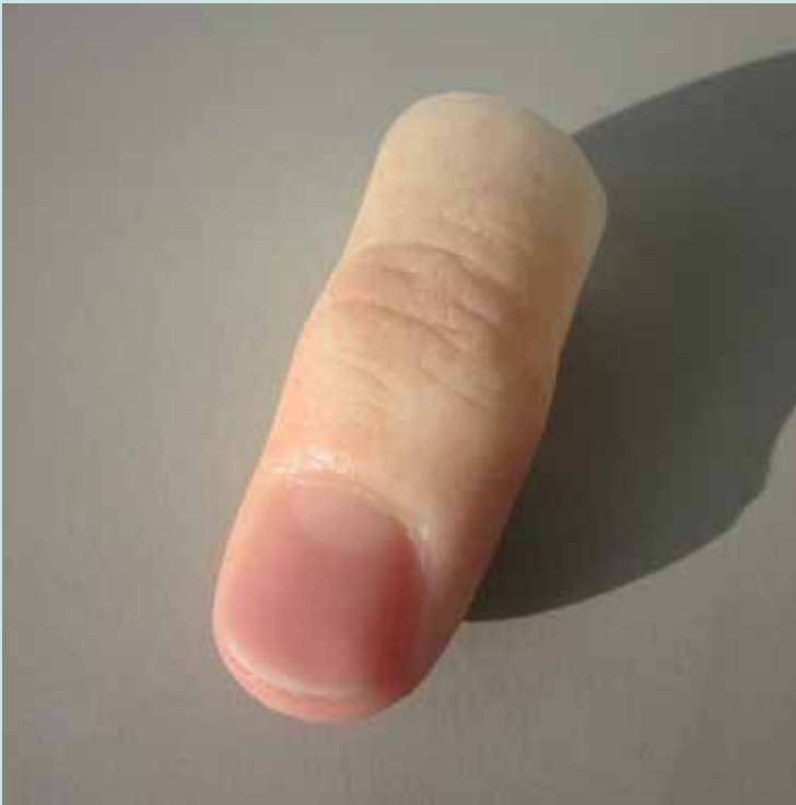
Silikonfingerprothese » Classic « nach Maß