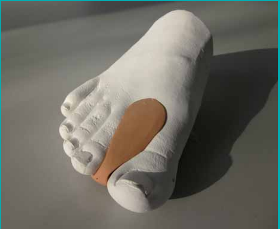
Zehenspreizkeil aus Silikon nach Maß