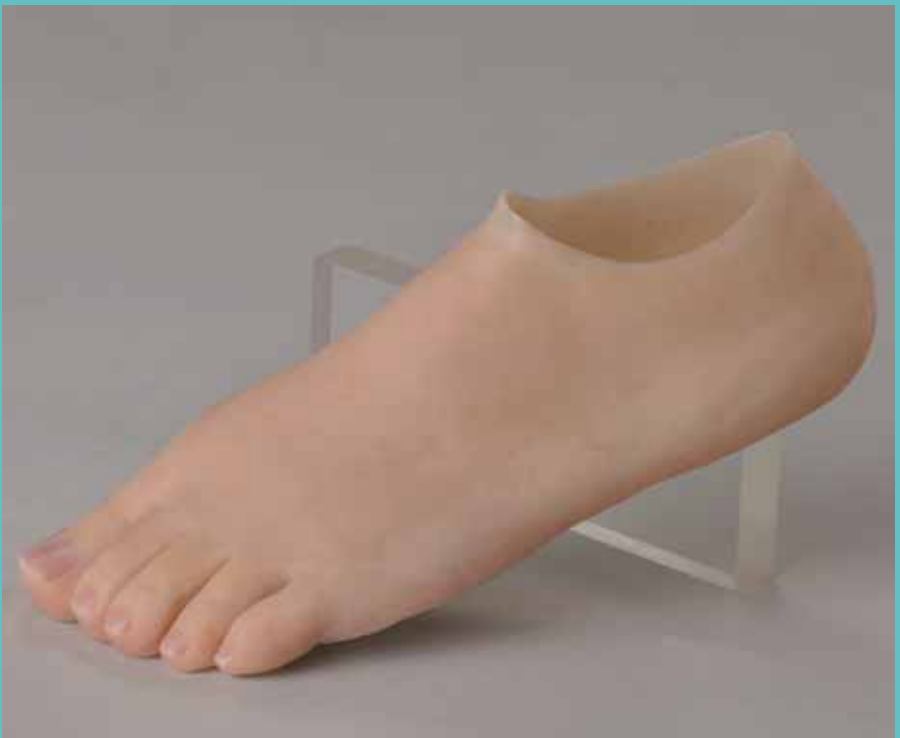
Silikon-Vorderfußprothese » Classic « nach Maß (auch in » Basic « und » Premium «)